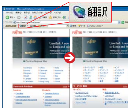
翻訳したいページを開き、ブラウザに登録された翻訳ボタンをクリックすると、ページがそのまま翻訳される

翻訳ソフトは、高い精度と豊富な機能で頼もしい「ATLAS 翻訳パーソナル2006」がオススメだ!